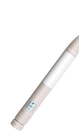
Pluma de insulina

Quizás sea la primera vez que se aplica una inyección usted mismo. Su equipo para el cuidado de la diabetes le enseñará las maneras seguras y cómodas de inyectarse la insulina. Las opciones para inyectarse la insulina son las siguientes: