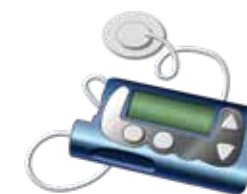
Bomba de insulina