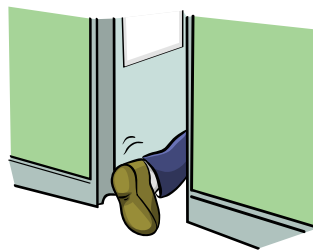
Necesita orinar más de lo usual