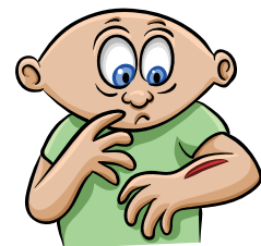
Infecciones o lesiones tardan más de lo usual en sanar

Para más información, visite Cornerstones4Care.com